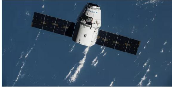
图：这次使用的龙飞船曾于 2016 年 7 月造访国际空间站

一旦 CIMON 到达国际空间站，盖斯特将欢迎它的到来，并在它帮助下进行两项科学试验。除 CIMON 外，SpaceX 龙飞船还将为国际空间站送去一台仪器——安装在国际空间站外部，用于测量地球上植物的温度。它还使科学家能了解地球上植物生态链的状况，以及植物是否缺水。