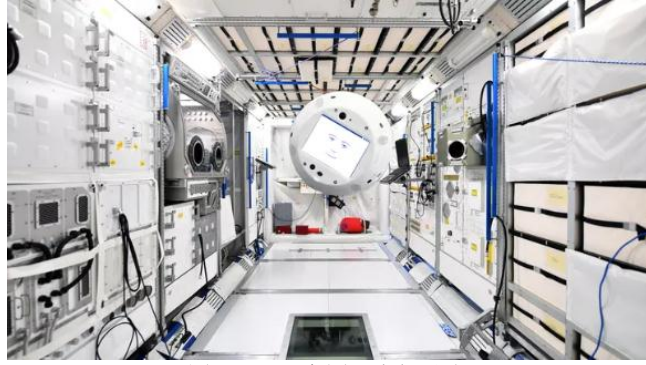
图：CIMON 在国际空间站上

一旦 CIMON 到达国际空间站，盖斯特将欢迎它的到来，并在它帮助下进行两项科学试验。除 CIMON 外，SpaceX 龙飞船还将为国际空间站送去一台仪器——安装在国际空间站外部，用于测量地球上植物的温度。它还使科学家能了解地球上植物生态链的状况，以及植物是否缺水。