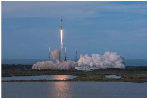
图：SpaceX 将发射猎鹰 9 火箭第 15 次执行为国际空间站运送补给任务

SpaceX 将第 15 次为美国航空航天局（以下简称“NASA”）执行向国际空间站运送补给的任务，利用猎鹰 9 火箭和龙飞船为国际空间站送去近 6000 磅各种物质，其中包括食物、水、科学实验用仪器设备和需要在太空微重力环境下测试的技术，最特别的是一只将在国际空间站上“生活”的人工智能机器人。